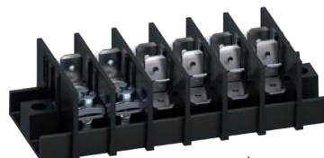
Serie 307-PCM Ausführung mit Schraubkontakt und 6-fach-Flachsteckerbestückungen