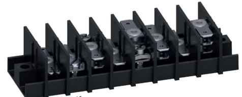
Serie 3070-PCM Bestückung mit 2- und 3-lagigen Flachsteckern sowie SAK-Schraubschluss