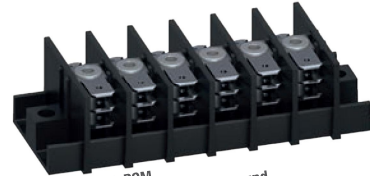
Serie 3070-PCM 3-lagige Flachstecker 4,8 mm und Schraubschluss