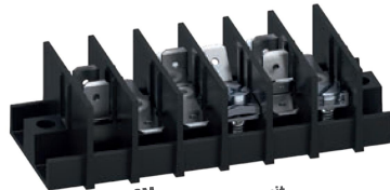
Serie 307-PCM Unterschiedliche Bestückung mit Schraubkontakten