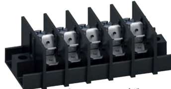
Serie 307-PCM Schraubanschluss und Flachstecker in 0°, 45° und 90°