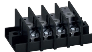
Serie 3070 mit zwei unterschiedlichen Flachsteckerbestückungen und SAK-Schraubanschluss