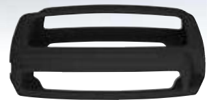
CTEK BUMPER 120