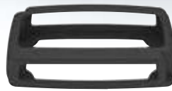
CTEK BUMPER 100